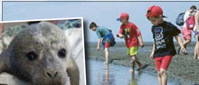
Wassersportler, Angler, Radfahrer und Sonnenhungrige anlockt.

Der AZUR Nordseecamp Dorumer Tief liegt nämlich noch vor dem Deich und Sie haben deshalb im wahrsten Sinne einen völlig freien Ausblick auf die Nordsee und die davorliegende Wattlandschaft . Neben der kleinen Kutterhafen, von wo aus täglich die Krabbenfischer zum Fang auslaufen und die neu gestaltete Hafenterrasse, wo Sie super frische Krabbenbrötchen und andere Fischspezialitäten erhalten. Wenige Meter entfernt liegt dann auch das Schwefelsole-Wellenfreibad , das Wellnessbad sowie die dazugehörige Riesenwasserrutsche und die Kurverwaltung mit Ihren vielfältigen Einrichtungen und der Kinderbetreuung . Logisch, dass die Nähe zur See vor allem